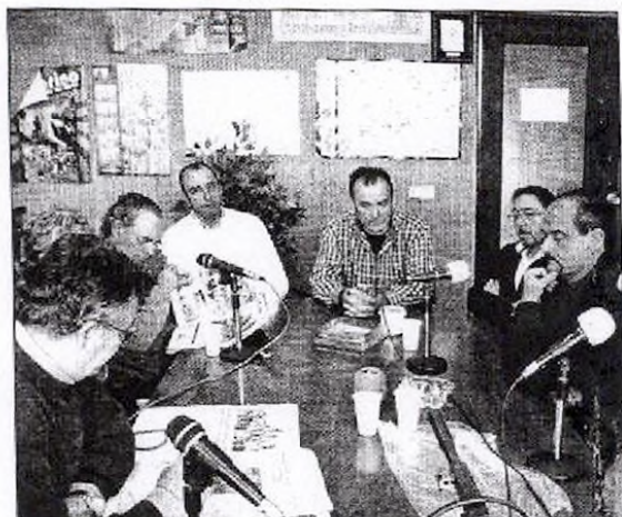
Participantes en la tertulia en la emisora municipal de Vitigudino.

El Premio Provincial de Turismo de La Salina tiene como fin reconocer el esfuerzo llevado a cabo por los municipios menores de 20.000 habitantes "en el ámbito de la recuperación, puesta en valor y promoción de los recursos turísticos provinciales". ■